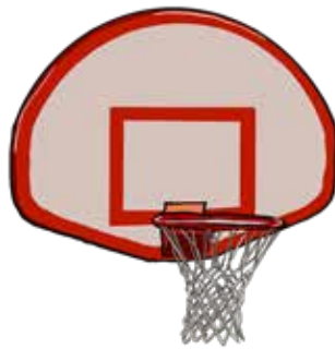
Aro y tablero de baloncesto